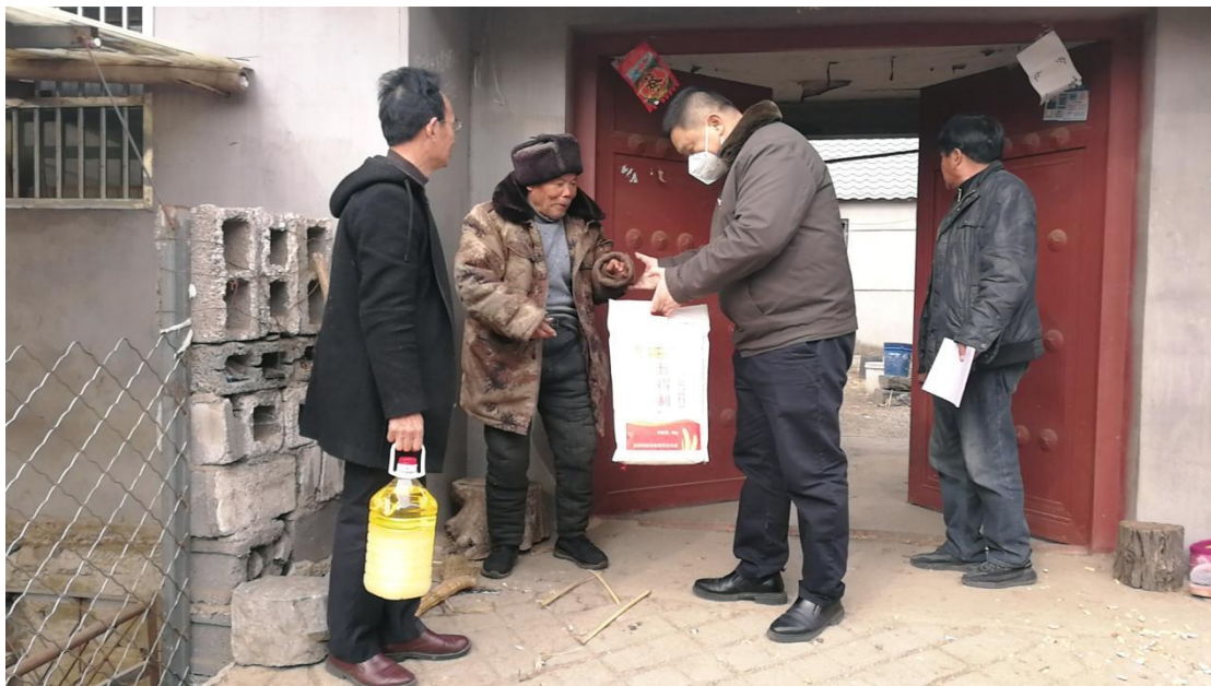
山东出版派驻的“第一书记”慰问增光峪村村民

积极宣传党的方针政策，不断加强党员队伍建设，充分发挥党员先锋模范作用，引导党员在党建引领乡村振兴中当好先锋、做出贡献。在驻村严格发展党员，培养和吸收入党积极分子，抓好思想和能力的提升，为党员队伍补充新鲜血液。