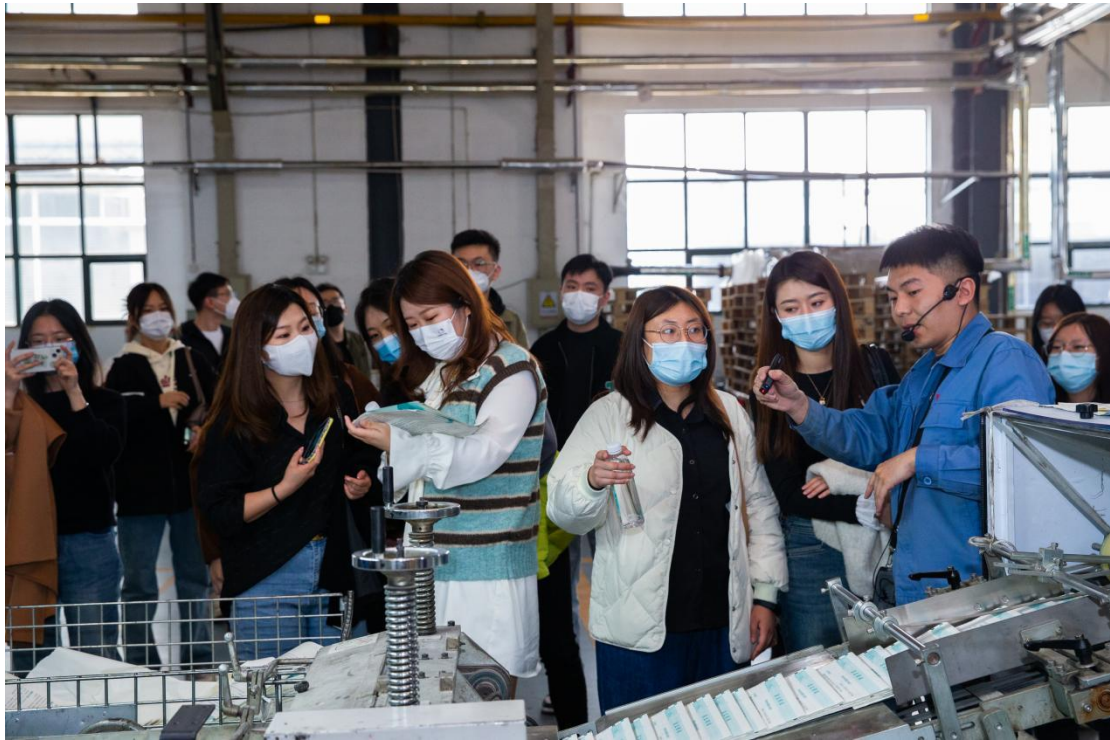
山东出版组织新员工培训

根据不同岗位，不同层次，不同专业，为员工提供特色化的培训课程，提高员工的业务素质 and 技能水平，建立畅通的人才成长通道，为员工的职业发展提供良好的平台。稳定员工队伍，形成良好的学习工作氛围，引导和激励干部职工干事创业。