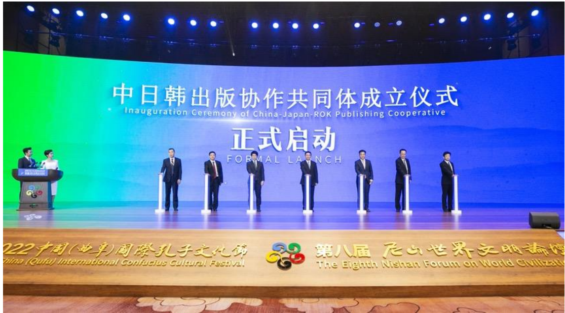
2022 年 9 月 27 日，第八届尼山世界文明论坛期间，山东出版组织成立中日韩出版协作共同体