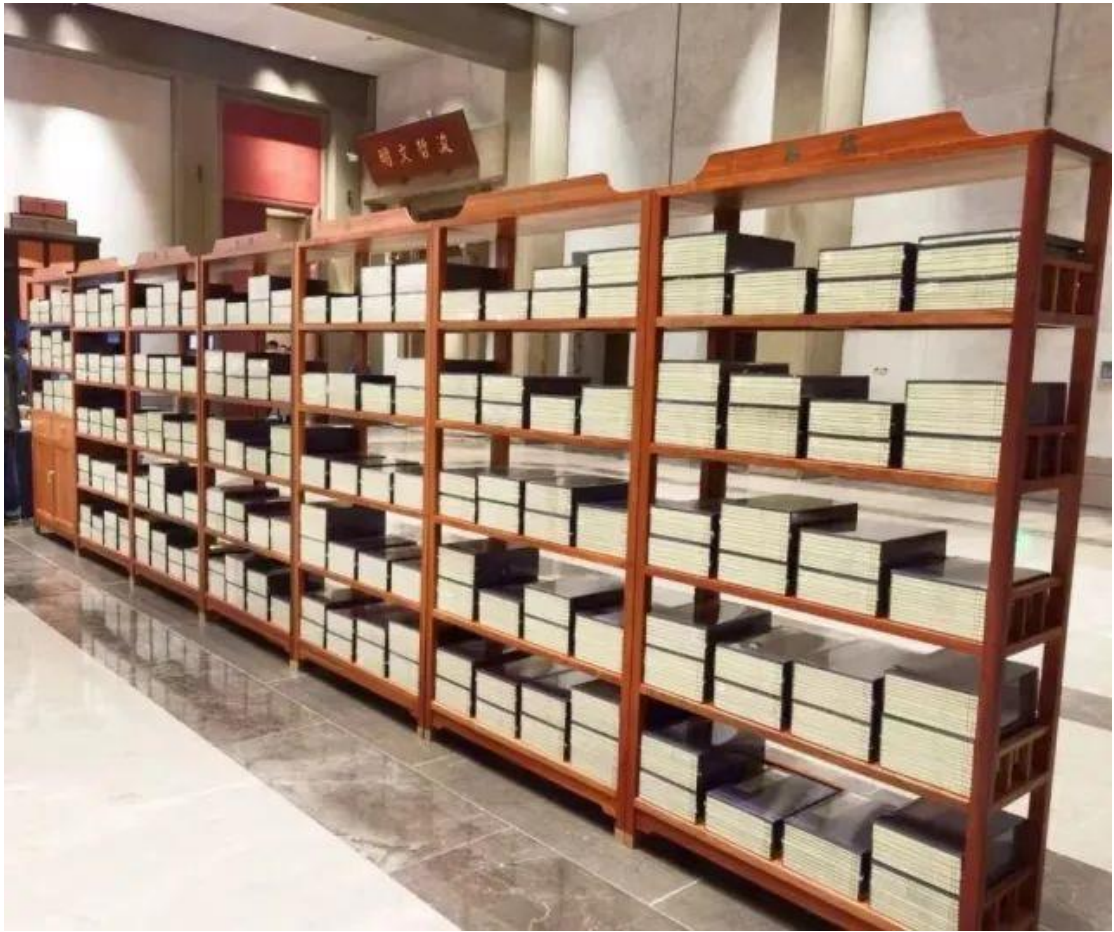
中华儒学经典著作集成——《儒典》