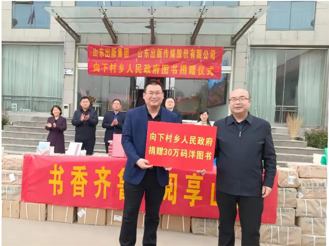
山东出版举办“书香齐鲁、阅享山东”图书捐赠活动

网点建设条件的乡镇，流动售书覆盖率在 70%以上；公司举办了“书香齐鲁、阅享山东”图书捐赠活动，为所派“第一书记”驻村下村乡人民政府捐赠各类图书 6990 册，价值 30 万元码洋，助力于农村文化建设。