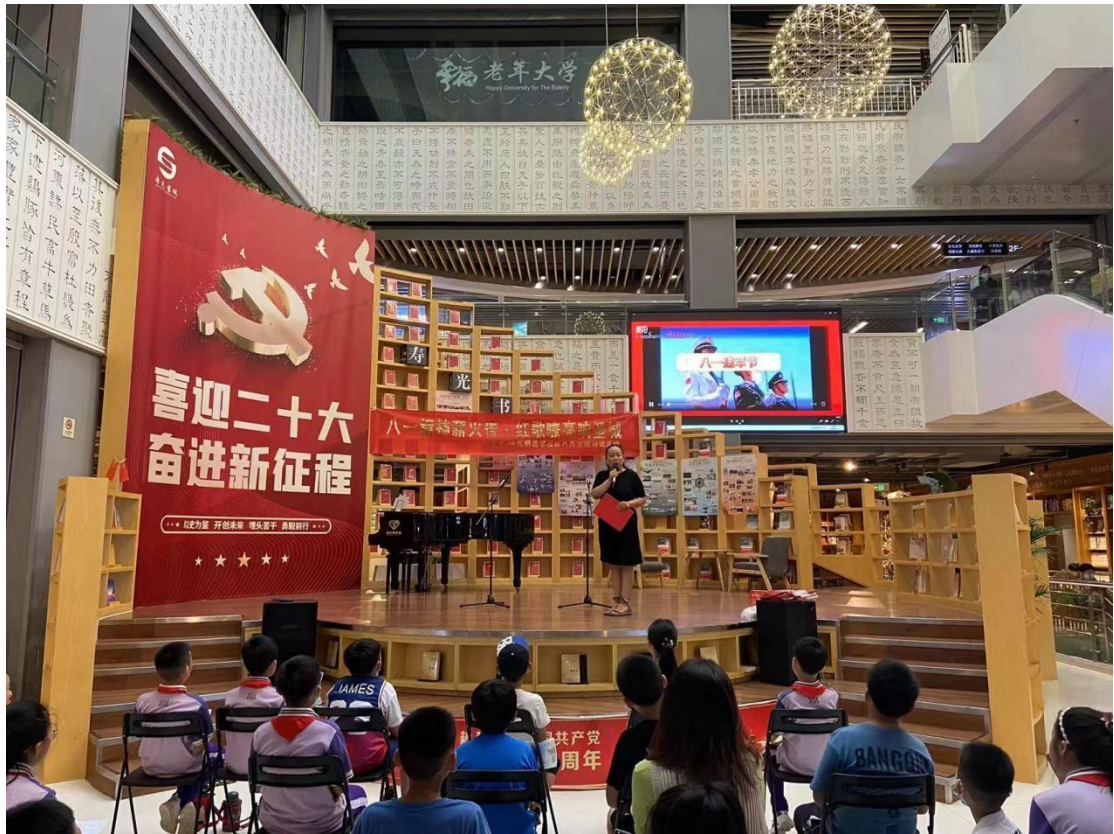
公司所属新华书店积极开展各类文化活动

全省新华书店开展主题展销、专题讲座、读者沙龙、亲子阅读、阅读摄影、“云”游书店等各类阅读活动，营造良好的文化氛围。通过短视频平台、直播平台、社群等线上渠道为读者构建云服务平台，全方位、多角度、深层次地将各种阅读主题活动生动地呈现在读者面前，拉近读者与图书的距离，满足人民群众日益增长的精神文化需求。报告期，全省统一策划开展主题展销、讲座签售等各类文化活动近 200 场。